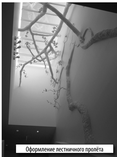
Оформление лестничного пролёта

компьютерами в старой библиотеке). Комната общественных собраний виртуально соединена с залом заседаний городского совета Западного Голливуда, который расположен на первом этаже здания новой библиотеки. Жители города смогут участвовать в заседаниях горсовета