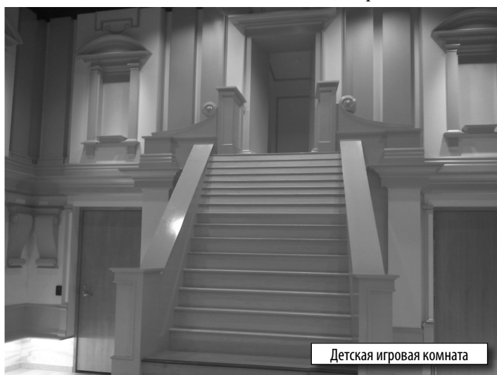
Детская игровая комната

На самом деле, жизнь сегодня не менее прекрасна, чем вчера. Вокруг нас происходит множество интересных, приятных событий, надо просто их замечать и участвовать в них. В том, то это правда я убедился в конце сентября во время специального события для прессы, устроенного горсоветом Западного Голливуда по случаю открытия новой библиотеки, построенной на территории парка на углу улиц Мелроуз и Сан-Висенте. Библиотека официально открывается 1 октября.