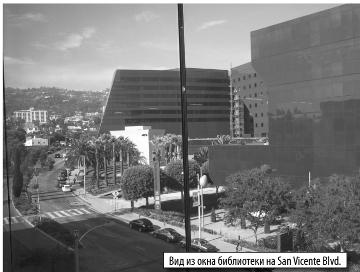
Вид из окна библиотеки на San Vicente Blvd.

В новой библиотеке даже предусмотрено помещение для агентства по трудоустройству для жителей города, услуги которого эффективны и совершенно бесплатны. Здание спроектировано таким образом, что практически все помещение днём просто заполнены солнечным светом и не нуждаются в дополнительном освещении. Частью библиотеки является пятиэтажная парковка с удобным подъездом с двух улиц, San Vicente Blvd. и Robertson Blvd.. Благодаря дополнительным парковочным местам, которые вознеслись над землёй, появляется возможность убрать пар-